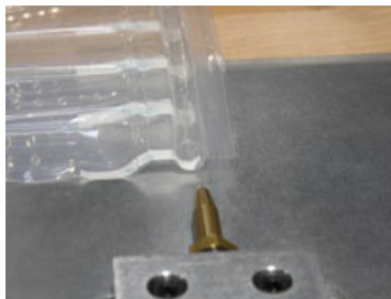
打开阀门，方便充气

小型的充气仪表，得到必要的压力，打开充气阀，几秒内完成充气的动作。它可以夹在任何桌面和和充气器连在一起。