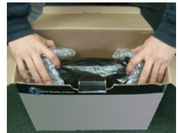
安装进盒子准备出货